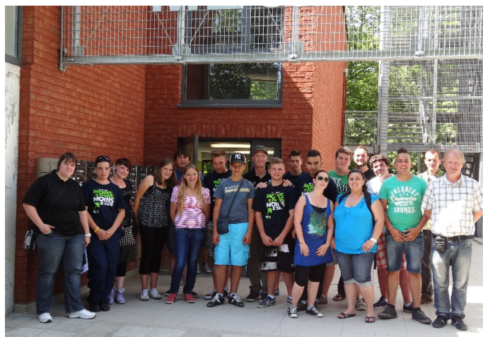
Clôture d'Eté Solidaire, je suis partenaire" édition 2013