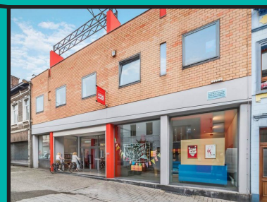
Le Centre de la Gravure accessible à 100%