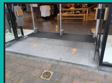
Certains commerces accessibles