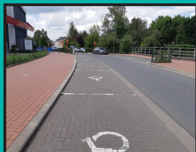
Le Point d'Eau accessible à 100%